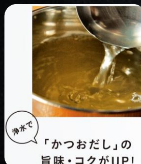
▶「かつおだし」旨味比較